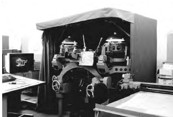
Figura 2. Restituïdor estereofotogràfic A8, de Wild, avui emmagatzemat, en l'època en què s'utilitzava a l'ICC.

Finalment, una col·lecció de gravats i planxes litogràfiques, moltes de les quals provenen de l'editorial Montblanc i un grup important pertanyent a l'antic Servei Topogràfic de la Generalitat republicana, que són utilitzades per al tiratge d'alguns fulls del mapa 1:100.000 de Catalunya.